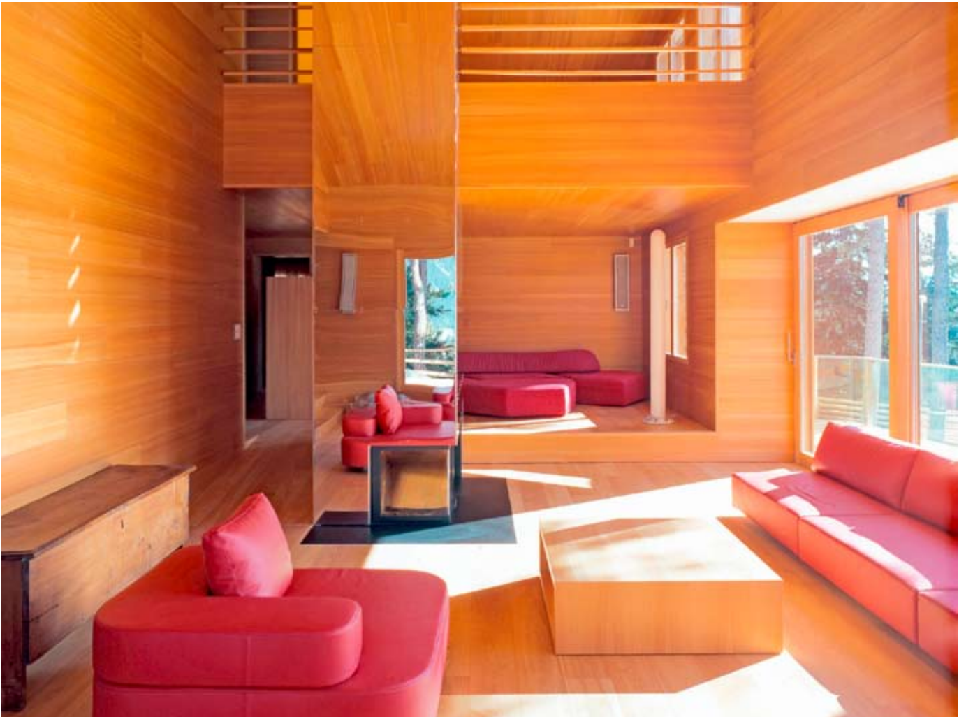
Hannes Henz, Zürich / LIGNUM

Der Reizstoff Formaldehyd ist in der Innenraumluft unerwünscht. Entsprechend sollten für eine gute Raumluftqualität die Formaldehydwerte möglichst tief liegen. Dieses Ziel kann durch diverse Massnahmen beim Bauen, Renovieren, Wohnen und Arbeiten erreicht werden. Kommt es zu Beschwerden mit Verdacht auf zu hohe Formaldehydbelastungen, sollte eine Raumluftmessung Klarheit schaffen. Formaldehydkonzentrationen über dem BAG-Richtwert für Innenräume gilt es mit Sanierungsmassnahmen zu senken.